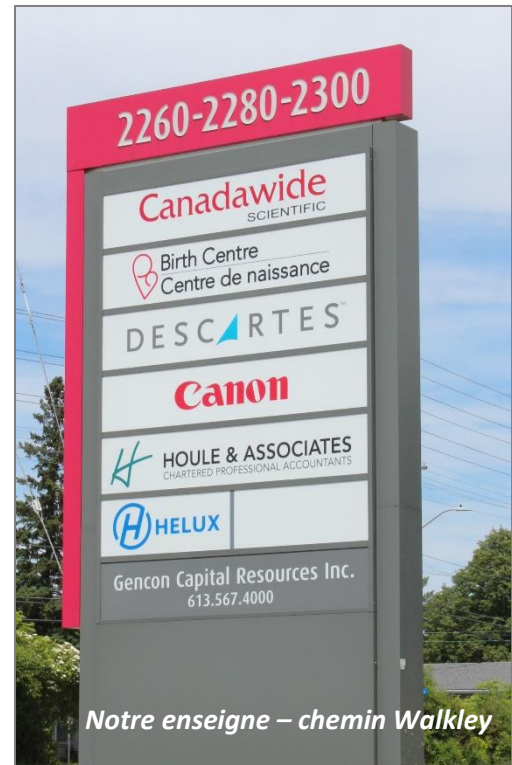
Notre enseigne – chemin Walkley