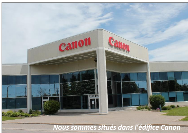
Nous sommes situés dans l'édifice Canon