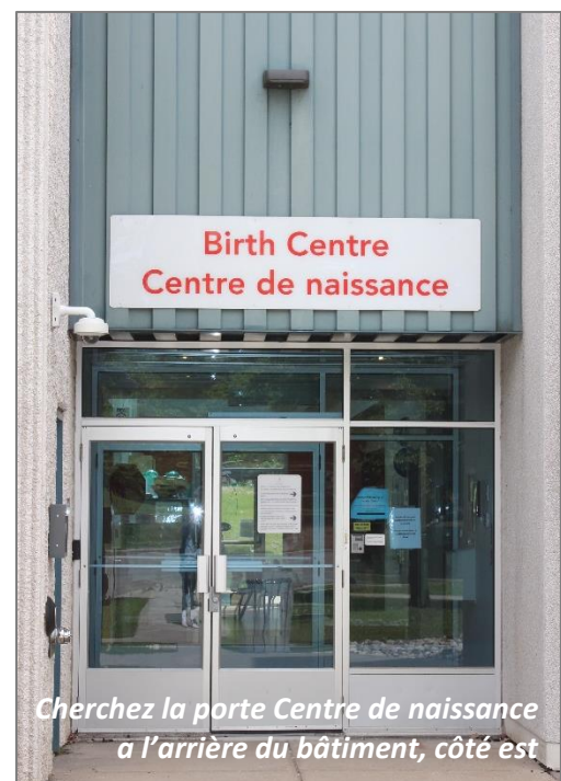
Cherchez la porte Centre de naissance à l'arrière du bâtiment, côté est